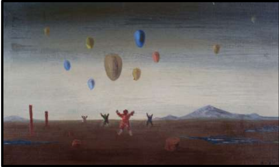
Portinari – Meninos com balões, 12/08/1951.